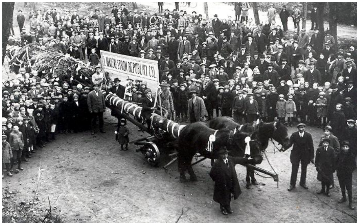
Slavnostní vztyčení stromu na náměstí Svobody v Brně 13. prosince 1924